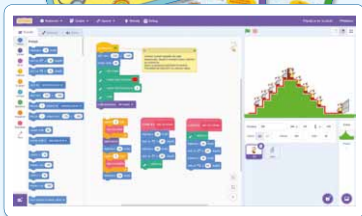
ukázka z předchystaného projektu pro práci ve Scratchi